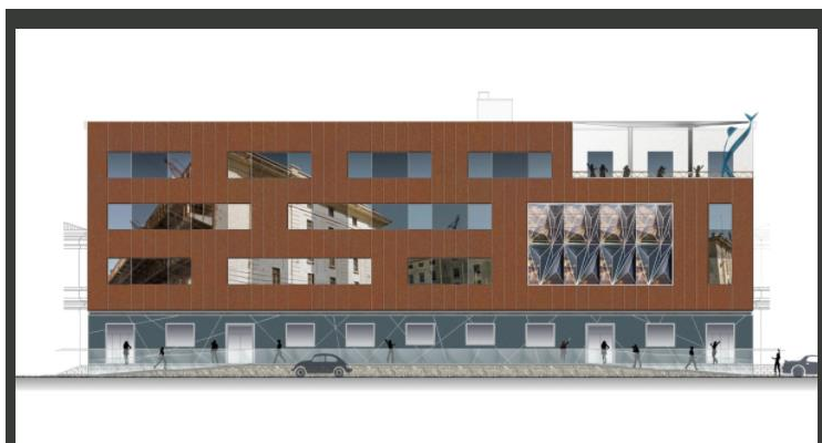
Il progetto Urban Center di Trieste